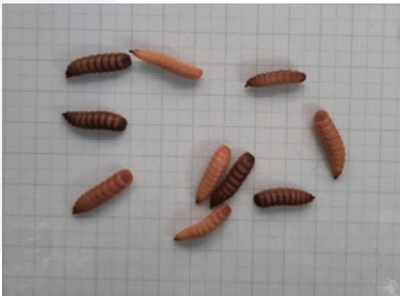
ภาพที่ 3-3 อนุอนแมลงวันลายอายุ 30 วัน ในกระบะที่ใส่อนุอน 200 ตัว