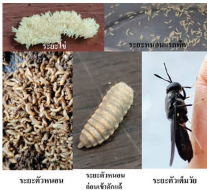
ภาพที่ 1 ระยะต่าง ๆ ในวงจรชีวิตแมลงวันลาย

ทั้งนี้เนื่องจากมีขยะอินทรีย์ประเภทขยะอาหารจำนวนมากเกิดขึ้นจากการบริโภคอาหารในช่วงเวลากลางวัน ที่โรงอาหารของมหาวิทยาลัยแต่ละวัน และเป็นปัญหาสำคัญที่มีผลกระทบต่อสิ่งแวดล้อมในมหาวิทยาลัย ในมุมมองเกี่ยวกับขยะอินทรีย์ของคณะผู้วิจัยจึงให้ความสำคัญกับประเด็นการจัดการที่เป็นมิตรกับสิ่งแวดล้อม งานวิจัยนี้จึงมุ่งเน้นที่การประยุกต์ใช้หนอนแมลงวันลาย (BSFL) ในการจัดการอินทรีย์ประเภทขยะอาหาร โดยศึกษาการเจริญเติบโตของหนอนแมลงวันลายเมื่อเลี้ยงด้วยขยะเศษอาหารจากโรงอาหาร ซึ่งวงจรชีวิตของหนอนแมลงวันลายแสดงดังรูปที่ 1