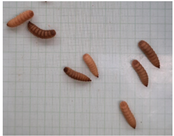
ภาพที่ 3-2 อนุอนแมลงวันลายอายุ 30 วัน ในกระบะที่ใส่อนุอน 100 ตัว