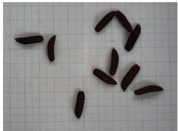
ภาพที่ 3-4 อนุอนแมลงวันลายอายุ 30 วัน ในกระบะที่ใส่อนุอน 400 ตัว

นอกเหนือจากผลการวิจัยดังกล่าวแล้ว ผู้วิจัยมีแนวคิดหรือข้อเสนอแนะเพื่อการขยายผลหรือต่อยอดงานวิจัยที่คาดว่าจะจะเป็นประโยชน์ต่อไป ได้แก่ ควรพัฒนาวิธีการเลี้ยงโดยศึกษาการใช้อาหารที่เหมาะสมกับของอนุอน เพิ่มคุณค่าทางอาหารที่ใช้เลี้ยงอนุอนโดยการหมักอาหารด้วยจุลินทรีย์ก่อนนำไปเลี้ยงอนุอน และปรับปรุงถังหมักที่ใช้เลี้ยงให้เหมาะสม เช่น การลดระยะเวลาในการย่อยงยอาหาร