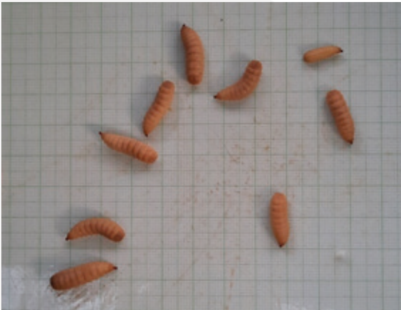
ภาพที่ 3-1 อนุอนแมลงวันลายอายุ 30 วัน ในกระบะที่ใส่อนุอน 50 ตัว