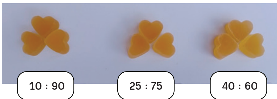
ภาพที่ 2 ผลผลิตกัมมีเยลลี่เร่วหอม ที่มีอัตราส่วนของ เร่วหอม : น้ำเปล่า แตกต่างกัน 3 ระดับ ได้แก่ 10:90 25:75 และ 40:60

ผลการศึกษาพบว่า ผลผลิตกัมมีเยลลี่เร่วหอมที่มีอัตราส่วนของ เร่วหอม : น้ำเปล่า เท่ากับ 40 : 60 เป็นอัตราส่วนที่เหมาะสมที่สุด ได้รับการยอมรับทางประสาทสัมผัสจาก ผู้ทดสอบมากที่สุด โดยได้คะแนนความชอบโดยรวมในระดับชอบเล็กน้อย มีค่าสี L^* , a^* และ b^* เท่ากับ 26.47 8.10 และ 8.90 ตามลำดับ มีปริมาณของแข็งที่ละลายน้ำได้ทั้งหมด 65.3 o Brix มีค่า hardness เท่ากับ 3,660.76 gf ค่า cohesiveness เท่ากับ 2.76 ค่า springiness เท่ากับ 0.49 s ค่า chewiness เท่ากับ 4,872.07 gf และ ค่า gumminess เท่ากับ 10,053.43 gf ค่า aw เท่ากับ 0.90 ค่าความเป็นกรด-ด่าง (pH) เท่ากับ 3.95 มีองค์ประกอบทางเคมี ได้แก่ ความชื้นร้อยละ 29.59 โปรตีนร้อยละ 12.77 ไขมันร้อยละ 0.004 และเถ้า ร้อยละ 0.31 ตามลำดับ