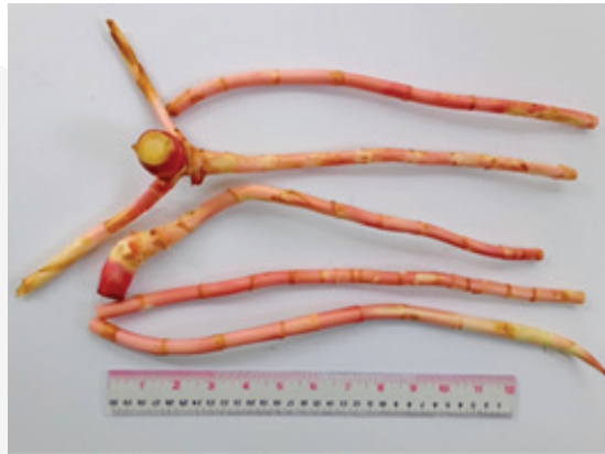
ภาพที่ 1 เหง้าและไหลของเร่วหอม

ผลการศึกษาพบว่า ผลผลิตกัมมีเยลลี่เร่วหอมที่มีอัตราส่วนของ เร่วหอม : น้ำเปล่า เท่ากับ 40 : 60 เป็นอัตราส่วนที่เหมาะสมที่สุด ได้รับการยอมรับทางประสาทสัมผัสจาก ผู้ทดสอบมากที่สุด โดยได้คะแนนความชอบโดยรวมในระดับชอบเล็กน้อย มีค่าสี L^* , a^* และ b^* เท่ากับ 26.47 8.10 และ 8.90 ตามลำดับ มีปริมาณของแข็งที่ละลายน้ำได้ทั้งหมด 65.3 o Brix มีค่า hardness เท่ากับ 3,660.76 gf ค่า cohesiveness เท่ากับ 2.76 ค่า springiness เท่ากับ 0.49 s ค่า chewiness เท่ากับ 4,872.07 gf และ ค่า gumminess เท่ากับ 10,053.43 gf ค่า aw เท่ากับ 0.90 ค่าความเป็นกรด-ด่าง (pH) เท่ากับ 3.95 มีองค์ประกอบทางเคมี ได้แก่ ความชื้นร้อยละ 29.59 โปรตีนร้อยละ 12.77 ไขมันร้อยละ 0.004 และเถ้า ร้อยละ 0.31 ตามลำดับ