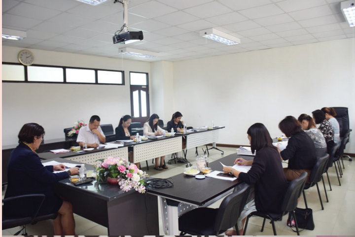
มหาวิทยาลัยราชภัฏรำไพพรรณี Rambhai Barni Rajabhat University