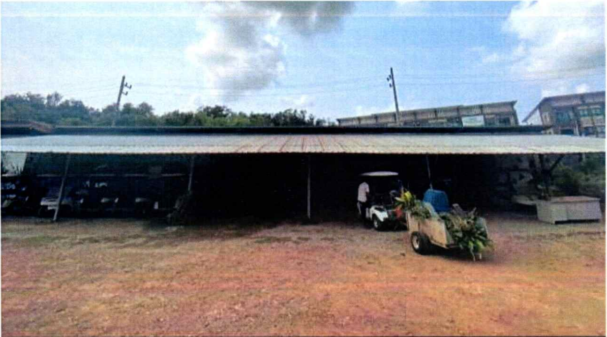
ภาพประกอบพื้นที่เช่า บริเวณพื้นที่ให้บริการรถกอล์ฟ