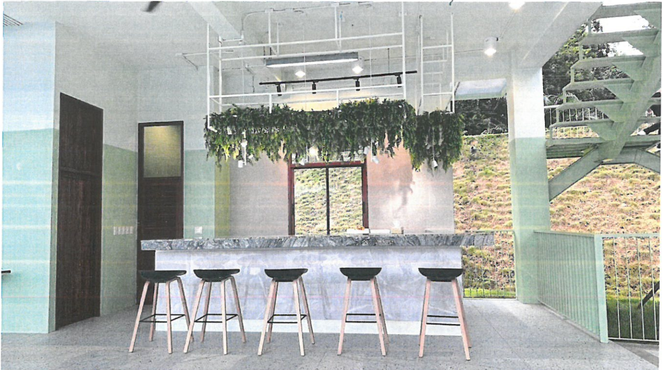
ภาพประกอบพื้นที่เช่า บริเวณสนามไตรฟอล์ฟ