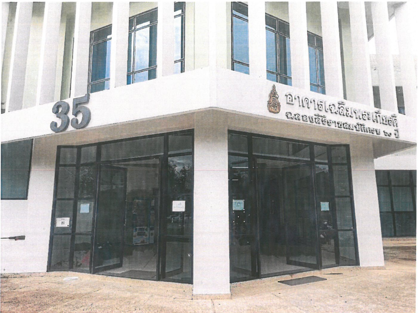
ภาพประกอบพื้นที่อาคารเฉลิมพระเกียรติ (อาคาร ๓๕)