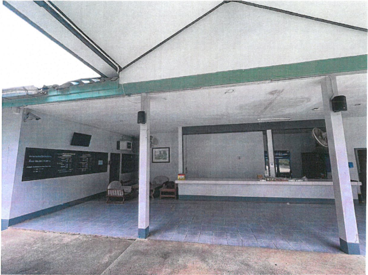
ภาพประกอบพื้นที่เช่า บริเวณสนามกอล์ฟ