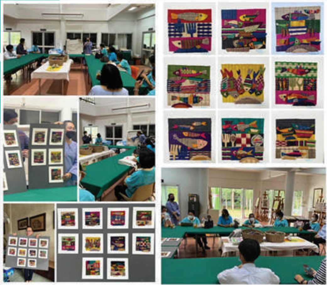
ภาพที่ 2 : บรรยาการการค้นข้อมูลงานวิจัยให้กับสมาชิกกลุ่มวิสาหกิจชุมชนกลุ่มเสื้อบ้านท่าแฉลบ

นอกเหนือจากผลการวิจัยดังกล่าวแล้ว ผู้วิจัยมีแนวคิดหรือข้อเสนอแนะเพื่อการขยายผลหรือต่อยอดงานวิจัยที่คาดว่าจะจะเป็นประโยชน์ต่อไปคือ