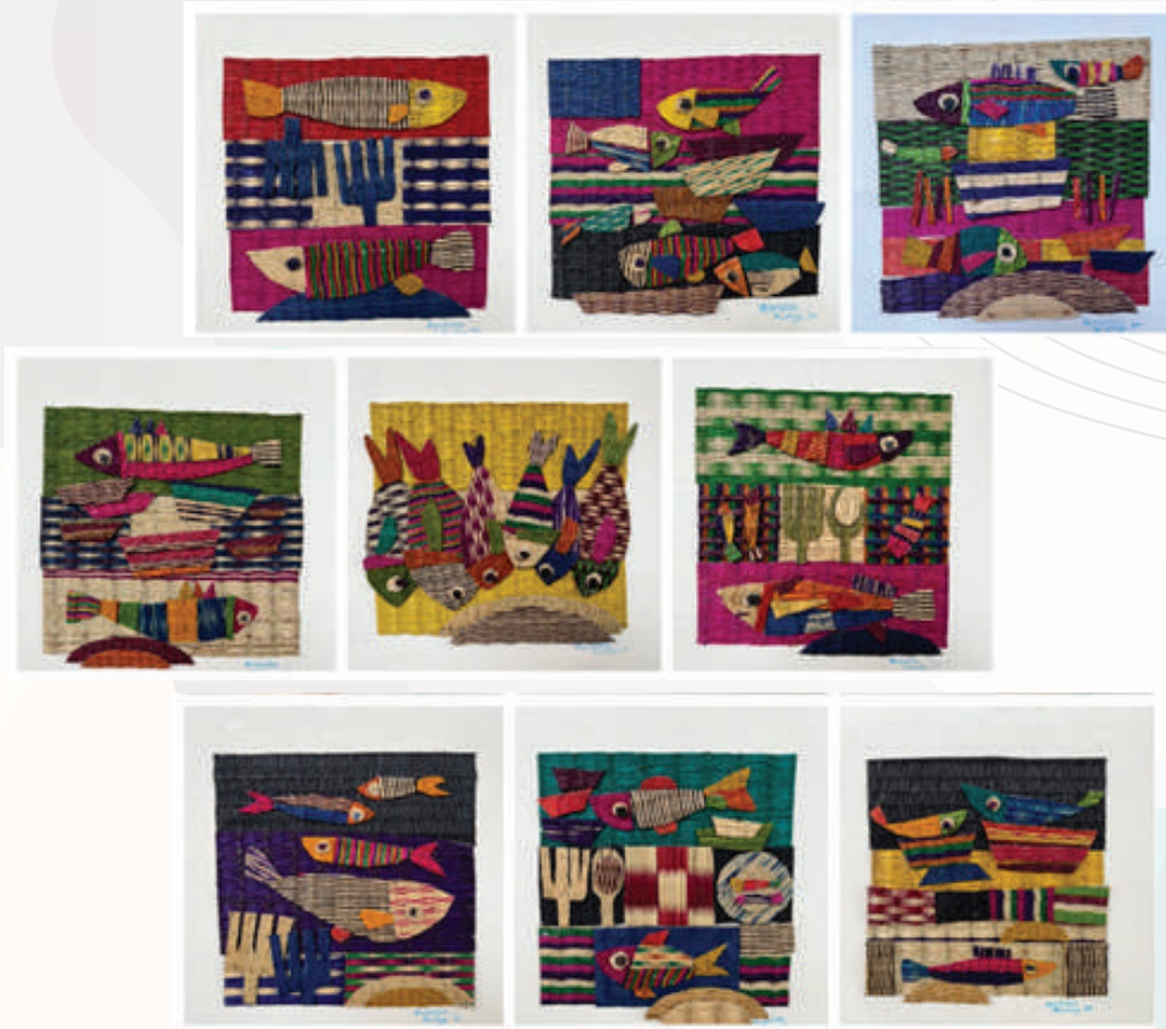
ภาพที่ 1 : ผลงานต้นแบบประเภทภาพปะติดเศษเสื่อกกบนผ้าใบที่เสร็จสมบูรณ์จำนวน 10 ชิ้น

เสื่อมสลายไปตามกาลเวลาแล้ว ยังเป็นการพยายามดำเนินงานของกลุ่มอาชีพเพื่อนำไปสู่การพึ่งตนเองได้ เป็นชุมชนเข้มแข็ง มีการพัฒนาอย่างยั่งยืน เป็นรากฐานในการพัฒนาเศรษฐกิจชุมชนให้ยั่งยืนต่อไป