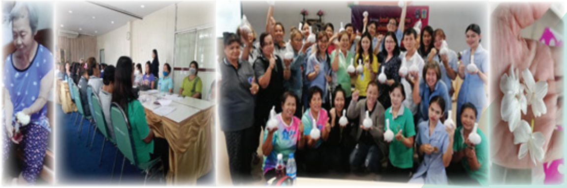
ภาพที่ 2 ภาพกิจกรรม

นอกเหนือจากผลการวิจัยดังกล่าวแล้ว ผู้วิจัยมีแนวคิดหรือข้อเสนอแนะ เพื่อการขยายผล หรือต่อยอดงานวิจัยที่คาดว่าจะจะเป็นประโยชน์ต่อไปคือ ผู้สูงอายุควรมีความรู้เรื่องการดูแลตนเองโดยเฉพาะเรื่องภาวะซึมเศร้า ควรฝึกทำกิจกรรมด้วยตนเอง การร่วมกลุ่มกิจกรรมจะทำให้ไม่ซึมเศร้าและถ้ามีกิจกรรมที่ทำด้วยตนเอง ผู้สูงอายุจะมีความภาคภูมิใจและถ้าได้จำหน่ายมีรายได้ มีเงิน ยิ่งสามารถป้องกันภาวะซึมเศร้าได้ดีมาก กิจกรรมที่ผู้สูงอายุชอบทำคือ ลูกประคบ เป็นต้น