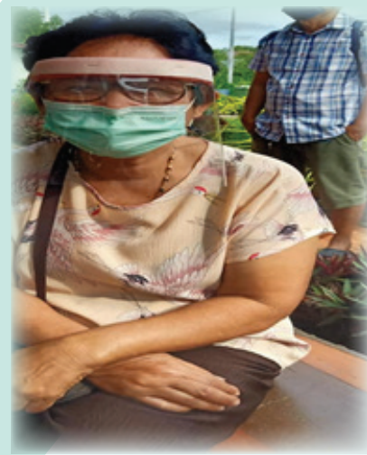
ภาพที่ 1 ภาพแสดงผู้สูงอายุทำแบบคัดกรองซึมเศร้า 9 Q

โปรแกรมการพัฒนาการรับรู้ความสามารถของตนเอง เพื่อป้องกันภาวะซึมเศร้าของผู้สูงอายุในชุมชน ส่วนที่ 1 การฝึกจิตและการดูแลตนเองเรื่องซึมเศร้า ส่วนที่ 2 การรับรู้ความสามารถของตนเอง การปฏิบัติเพื่อดูแลตนเอง ฝึกการจัดการความเครียด และส่วนที่ 3 กิจกรรมเพื่อเพิ่มคุณค่าตนเอง เช่น การฝึกทำกิจกรรมด้วยตนเอง การทำลูกประคบ การฝึกสมาธิฯ (ภาพที่ 2) พบว่า โปรแกรมการรับรู้ความสามารถของตนเองมีประสิทธิภาพ ทำให้ผู้สูงอายุมีภาวะซึมเศร้า หลังการอบรมอยู่ในระดับลดลงเป็นที่น่าพอใจ ทำให้ผู้สูงอายุมีการรับรู้ความสามารถของตนเองสูงขึ้น มีความรู้เพื่อดูแลตนเองด้านสุขภาพของตนเองสูงขึ้นหลังเข้าไปอบรมฯ ตลอดจนมีกิจกรรมกลุ่ม มีฝึกทำกิจกรรมด้วยตนเอง และมีรายได้เพิ่ม เช่น การทำลูกประคบช่วยป้องกันภาวะซึมเศร้าได้ ค้าง ( ภาพที่ 2)