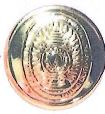
รูปที่ ๒ เครื่องหมายหน้าหมวก

พื้นด้านหลังมีลักษณะผิวขรุขระ ขอบค้อมีลักษณะเรียบเงาและโค้ง