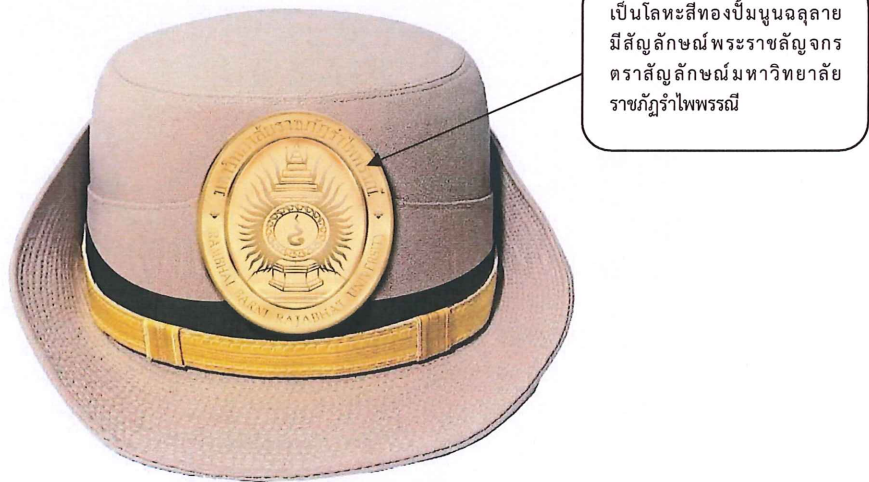
รูปที่ ๔ หมวกพนักงานมหาวิทยาลัย ชาย

เป็นโลหะสีทองปั้มนูนจตุลลาย มีสัญลักษณ์พระราชลัญจกร ตราสัญลักษณ์มหาวิทยาลัย ราชภัฏรำไพพรรณี