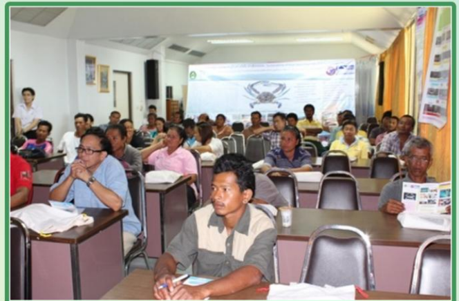
ภาพกิจกรรมการศึกษาทรัพยากรปูม้า ณ อ่าวคู้งกระเบน จังหวัดจันทบุรี

ผลการวิจัย พบว่าแนวโน้มของประชากรปูม้าในอ่าวคู้งกระเบนนั้นเพิ่มขึ้นมากขึ้่น โดยพิจารณาจากตัวชี้วัดทางชีววิทยาที่สำคัญ ได้แก่ ประชากรปูม้าเพศเมียมีมากกว่าเพศผู้ นั้นแสดงว่าจะมีแม่ปูที่สมบูรณ์เพศสืบพันธุ์และวางไข่ให้ประชากรปูม้ามากขึ้น นอกจากนี้ยังพบว่าสัดส่วนของปูม้าตัวเต็มวัยมีเพิ่มขึ้น ซึ่งแสดงถึงว่าจะมีการวางไข่ที่อัตราการฟักไข่และอัตราการรอดตายเข้าสู่ช่วงการประมงเพิ่มขึ้น สำหรับการศึกษาค่าอัตราการนำปูม้ามาใช้ประโยชน์ในปัจจุบันพบว่ามีค่าลดลงเมื่อเปรียบเทียบกับการศึกษาก่อนหน้านี้ สำหรับการสร้างและใช้แบบจำลองเชิงบูรณาการเพื่อแลกเปลี่ยนเรียนรู้เรื่องการทำประมงปูม้า และผลกระทบต่อสัตว์น้ำพลอยได้ ผลการศึกษาพบว่าชาวประมงเป็นผู้ที่มีส่วนสำคัญและจำเป็นต้องเสริมสร้างความรู้ความตระหนักเกี่ยวกับการอนุรักษ์และใช้ประโยชน์สัตว์น้ำพลอยได้ จึงได้มีการสร้างแบบจำลองทางความคิด (Conceptual model) และสร้างแบบจำลองในรูปแบบเกมสวมบทบาทสมมุติที่มีคอมพิวเตอร์ช่วยคำนวณค่าตัวแปร