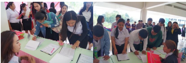
ภาพบรรยากาศการลงทะเบียน