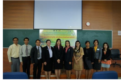
รักษาการผู้อำนวยการสถาบันวิจัยและพัฒนา ถ่ายภาพร่วมกับนักวิจัย