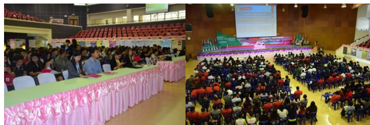
บรรยากาศการบรรยายพิเศษจากผู้ทรงคุณวุฒิ