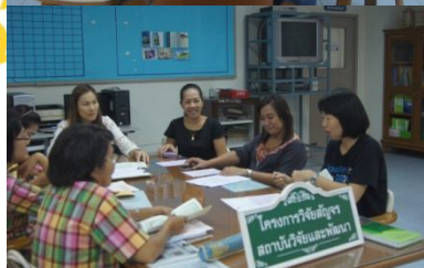
คณะเทคโนโลยีการเกษตร