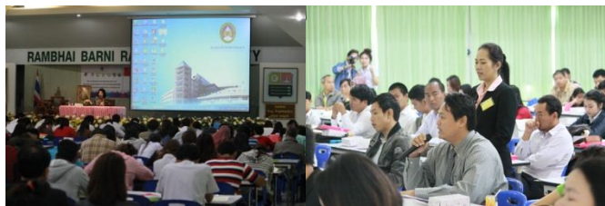
บรรยากาศการบรรยายพิเศษจากผู้ทรงคุณวุฒิ