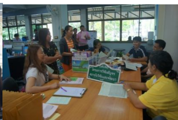
คณะครุศาสตร์