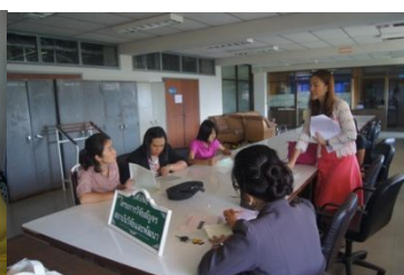
คณะนิเทศศาสตร์