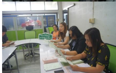
คณะวิทยาการคอมพิวเตอร์