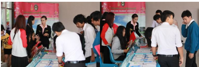
ภาพบรรยากาศการลงทะเบียน

ภายในงานจัดกิจกรรม การบรรยายพิเศษจากผู้ทรงคุณวุฒิ การนำเสนอผลงานวิจัยภาคบรรยาย และภาคโปสเตอร์ โดยแยกตามสาขาทั้งสิ้น 4 สาขา ได้แก่ สาขาการศึกษา สาขาการจัดการ/บริหารธุรกิจ สาขามนุษยศาสตร์และสังคมศาสตร์ และสาขาวิทยาศาสตร์และเทคโนโลยี นิทรรศการผลงานวิจัยจากคณะต่างๆ ภายในมหาวิทยาลัย บริเวณลานเอนกประสงค์ชั้น 1 อาคารเฉลิมพระเกียรติฉลองสิริราชสมบัติครบ 60 ปี ในวันที่ 19-20 ธันวาคม 2557 ในงานนี้มีผู้สนใจร่วมนำเสนอผลงานเข้าร่วมนำเสนอทั้งสิ้น 119 เรื่อง ผ่านการคัดเลือก 111 เรื่อง แบ่งเป็นภาคบรรยาย 82 เรื่อง ภาคโปสเตอร์ 29