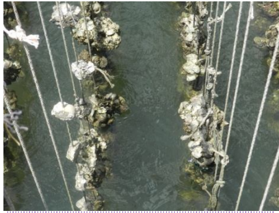
การเลี้ยงหอยนางรมปากจับ

ผลสำรวจด้านผลิตภัณฑ์หอยนางรม พบว่าผู้บริโภคมีความสนใจอยากบริโภคข้าวเกรียบหอยนางรมเป็นสินค้าขบเคี้ยวมากที่สุด และราคาจำหน่ายอยู่ในช่วง 40-50 บาท ส่วนสินค้าประเภทอาหารผู้บริโภคอยากบริโภคผลิตภัณฑ์น้ำพริกหอยนางรมมากที่สุด และราคาจำหน่ายอยู่ในช่วง 40-50 บาท