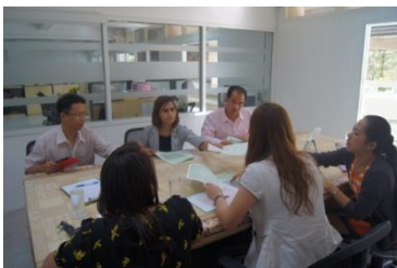
คณะนิติศาสตร์