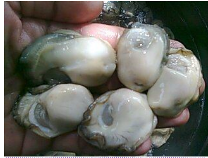
เนื้อหอยนางรม