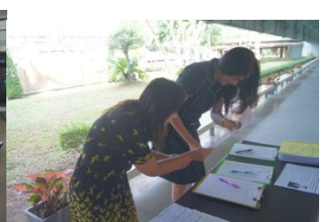
คณะมนุษยศาสตร์