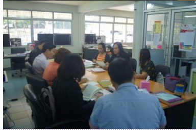
คณะอักษรศาสตร์