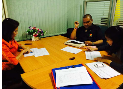
คณะครุศาสตร์