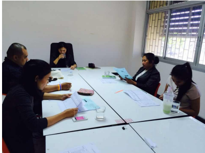
คณะวิทยาการจัดการ