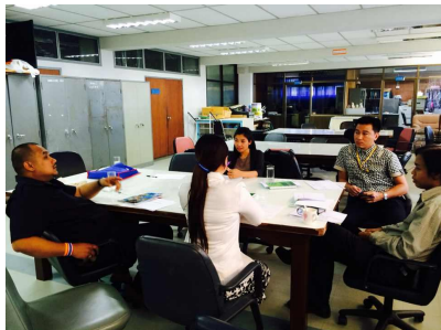
คณะนิเทศศาสตร์