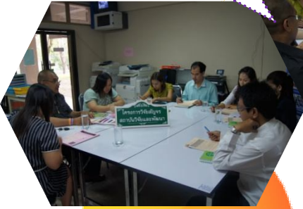
คณะนิติศาสตร์