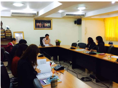
คณะเทคโนโลยีอุตสาหกรรมฯ