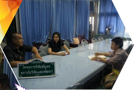
คณะมนุษยศาสตร์