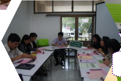
คณะวิทยาการคอมพิวเตอร์