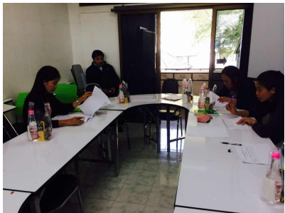
คณะวิทยาการคอมพิวเตอร์และเทคโนโลยีสารสนเทศ