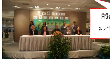
พิธีลงนามความร่วมมือ เครือข่าย มหาวิทยาลัยราชภัฏกลุ่มศรีอยุธยา