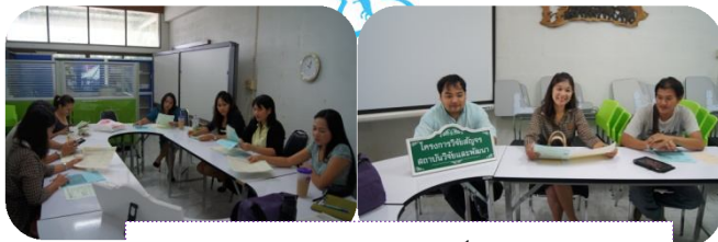
คณะวิทยาการคอมพิวเตอร์และสารสนเทศ