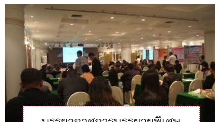
บรรยากาศการบรรยายพิเศษ