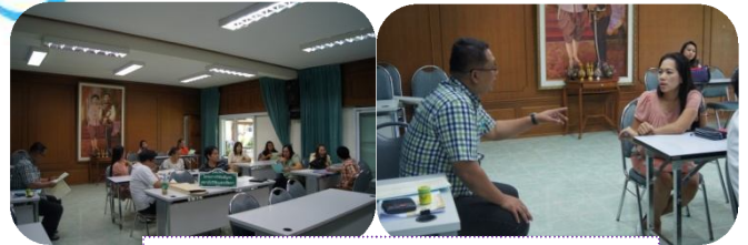
คณะมนุษยศาสตร์และสังคมศาสตร์