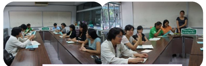
คณะวิทยาศาสตร์และเทคโนโลยี