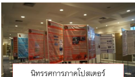
นิทรรศการภาคโปสเตอร์