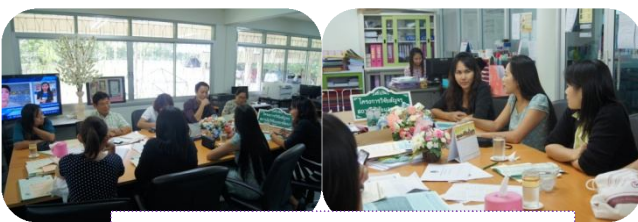
คณะอักษรศาสตร์และประยุกต์ศิลป์