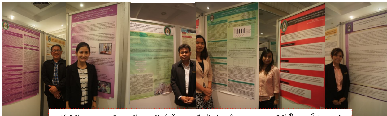
นักวิจัย จากมหาวิทยาลัยราชภัฏรำไพพรรณี เข้าร่วมนำเสนอผลงานวิจัยในภาคโปสเตอร์ ในงานประชุมวิชาการมหาวิทยาลัยราชภัฏกลุ่มศรีอยุธยา ครั้งที่ 4