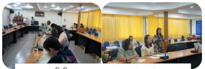
คณะเทคโนโลยีอุตสาหกรรมและอัญมณีศาสตร์