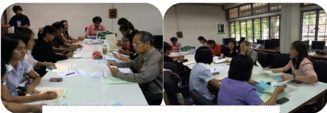
คณะนิเทศศาสตร์