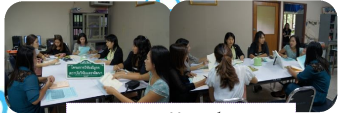
คณะนิติศาสตร์